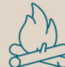
Zona de Fogatas