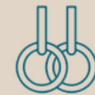
GYM / TRX