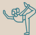
Centro de Relajación